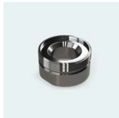
(G) Adapter für Anschluss 28