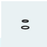
(D) Dichtungen für Kugelgelenk und Strahlregler