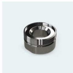
(G) Adapter für Anschluss 28